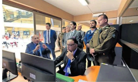
LA CIUDAD REGISTRA 22 HOMICIDIOS ESTE 2024 Y 25 CASOS DE INTENTO DE ASESINATO.

En materia de seguridad, cabe destacar que en lo que va de este año han ocurrido 7.068 delitos de mayor connotación social, tales como robo, homicidios, hurto y violaciones. La más preocupante la cifra de 22 homicidios, casi un 100% más comparado al año pasado a esta misma fecha, según datos de la Fiscalía.