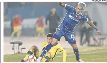
GUERRERO QUEDÓ DESCARTADO EN LOS AZULES POR LESIÓN.

De todas formas, tendrán que cuidar algunos futbolistas pensando en el cansancio acumulado por el duelo contra Cuiabá de mitad de semana, y la revancha contra el equipo brasileño del próximo jueves. ❄