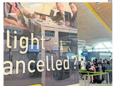
FALLA AFECTÓ MEDIOS DE COMUNICACIÓN, BANCA Y VUELOS COMERCIALES.

afectados suponen "menos del uno por ciento de todas las máquinas Windows". El apagón generó problemas que cancelaron vuelos, obligaron a cadenas de televisión a dejar de emitir y bloquearon acceso a servicios de salud o banca. CS