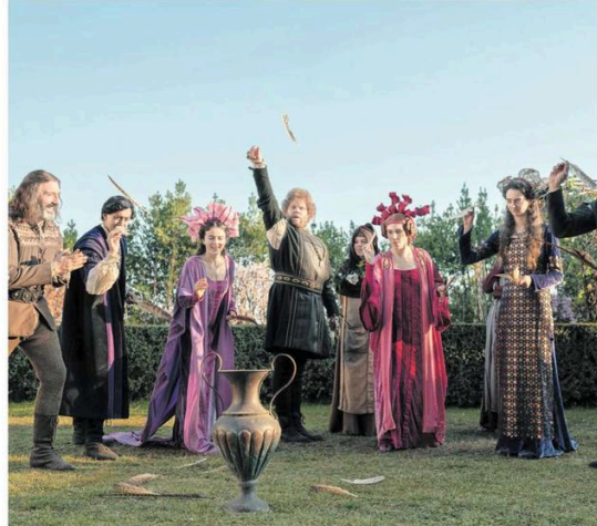
"EL DECAMERON" ESTÁ AMBIENTADA EN LA FLORENCIA DE 1348, EN PLENA PESTE BUBÓNICA.

AppleTV+ propone dentro de sus estrenos a "La dama del Lago", una serie de siete capítulos cada uno de 45 minutos de duración ambientada en Baltimore, a fines de los años sesenta, y protagonizada por Natalie Portman en el rol de Maddie Schwartz y Moses Ingram como Cleo Johnson; la primera es una madre y