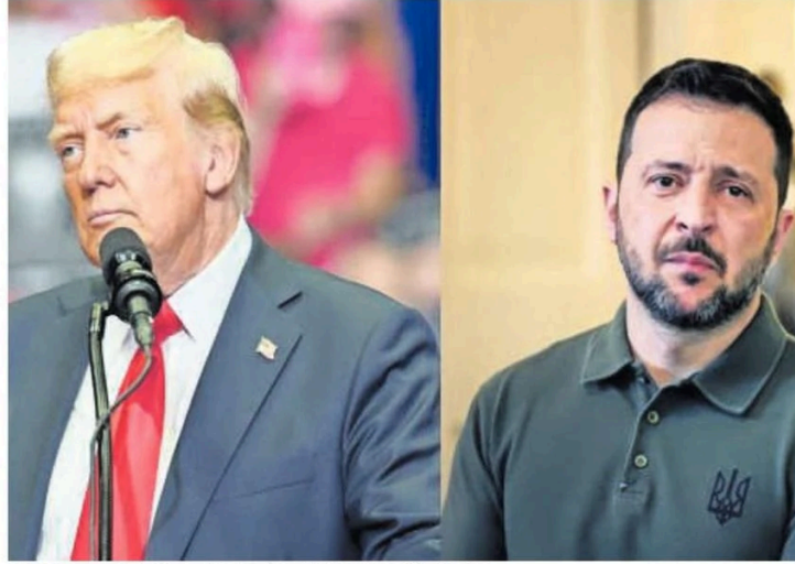
CANDIDATO REPUBLICANO, DONALD TRUMP, HABLÓ CON EL PRESIDENTE VOLODÍMIR ZELENSKI.

Trump indicó el viernes en su propia red social que, de convertirse en presidente de EE.UU., habrá negociaciones de paz para poner fin a la guerra de Rusia en Ucrania.