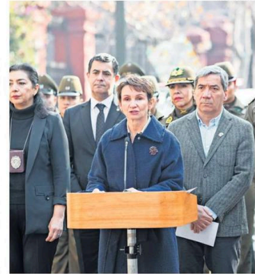
LA MINISTRA TOHÁ REALIZÓ UN POSITIVO BALANCE DEL PLAN.

“Ya no vamos a tener sólo a algunas comunas en este plan, sino a toda la Región Metropolitana”, avisó la ministra, junto con decir que este lunes tanto Carabineros como la PDI entregarán detalles en relación al reordenamiento de su personal para cumplir con es-