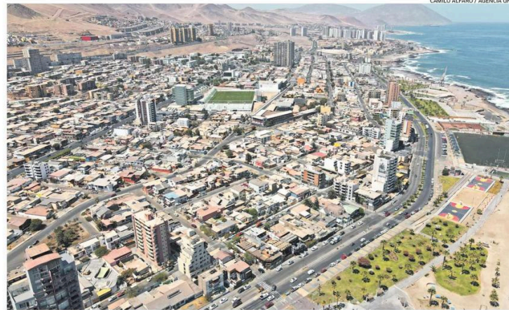
VISTA PANORÁMICA DE LA CAPITAL REGIONAL. CALIDAD DE VIDA, EDUCACIÓN, SEGURIDAD Y SALUD, SON ALGUNAS DEMANDAS.

Para ejemplificar, por patentes mineras el gobierno percibe más de $9 mil millones, mientras que por casinos de juegos recibe unos $4 mil millones (cifra que es igual a la que se reparte entre los municipios de la capital regional y Calama por los centros de juego allí existentes). Pero también entra en el desglose otro ítem: el Royalty. Según datos del Gobierno Regional, el monto relacionado a este flujo