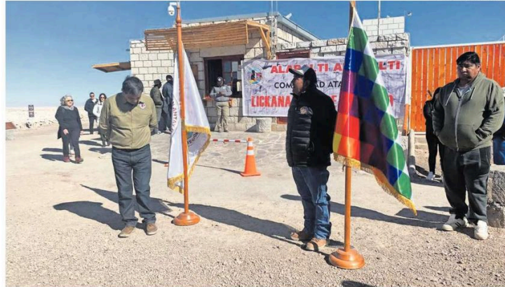
EL ACUERDO CODELCO-SQM HA GENERADO TENSIÓN EN SAN PEDRO, ESPECIALMENTE EN LA ZONA DE EXPLOTACIÓN DEL LITIO EN EL SALAR.

Ese énfasis es lo que ha puesto tensión al interior del CPA, ya que las comunidades del sur del salar sostienen, en menor o mayor grado, que ese estamento no está atendiendo a este reclamo. Son ellos los habitantes donde se realizan las operaciones las que están afectadas, es decir, no todas, se enfatiza.