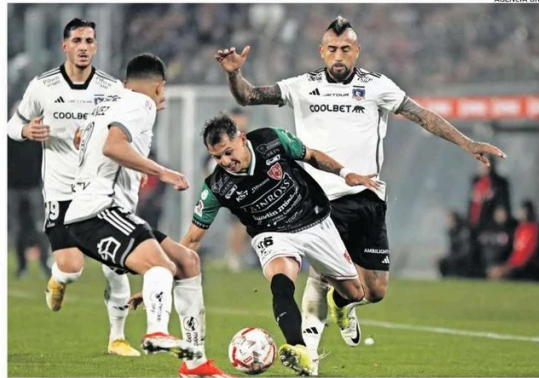
EL CACIQUE PERDIÓ EN LA FECHA PASADA DEL TORNEO ANTE DEPORTES COPIAPÓ.

El entrenador del Cacique, Jorge Almirón, tomó cartas en el