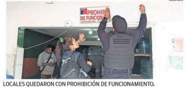
LOCALES QUEDARON CON PROHIBICIÓN DE FUNCIONAMIENTO.

En tanto, sostiene que proyectos de construcción, ya sea en educación u otro tipo de infraestructura “genera trabajo, y el trabajo obviamente mejora la calidad de vida”.