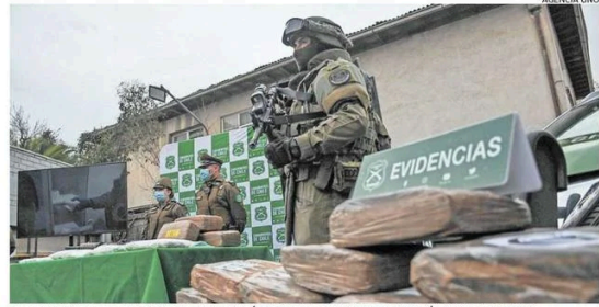
EL OPERATIVO POLICIAL CONJUNTO SE REALIZÓ EN LAS 52 COMUNAS DE LA REGIÓN METROPOLITANA.

Además, se informó que se produjeron dos persecuciones debido a que interceptaron dos delitos mientras se come-